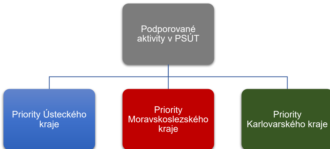
Obrázek 1 – Schéma členění podporovaných aktivit v PSÚT